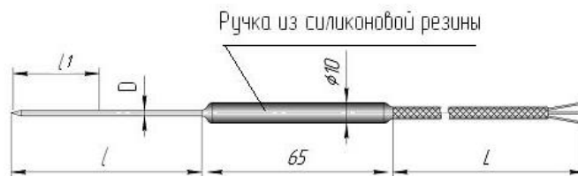
Рисунок 1 – Термопреобразователи сопротивления ТСПг и ТСМг в конструктивном исполнении К1И

2.3 Габаритные и установочные размеры термопреобразователей – в соответствии с рисунком 1.